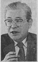
「デザイン博観会にスマイルな名古屋市長」と語る西郷市長